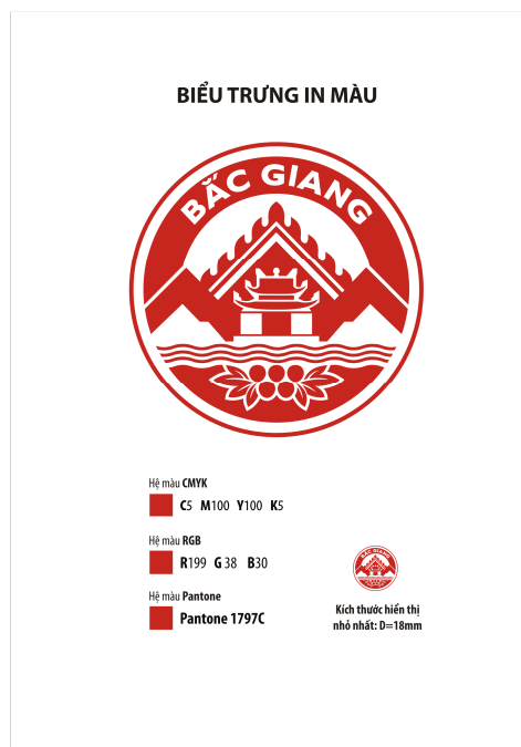
Hình 4. Mẫu với màu cơ bản